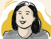
นักรัฐศาสตร์