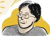
กวีปนวนกรสันติภาพ