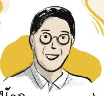
นักวิชาการสันติภาพ