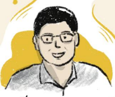
นักกฎหมาย